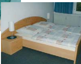
Ferienwohnung „Harz 3“