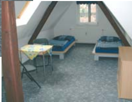
Ferienwohnung „Harz 1“