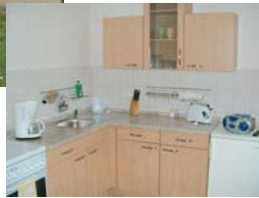
Ferienwohnung „Harz 2“